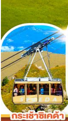
กระเช้าซีเคต้า