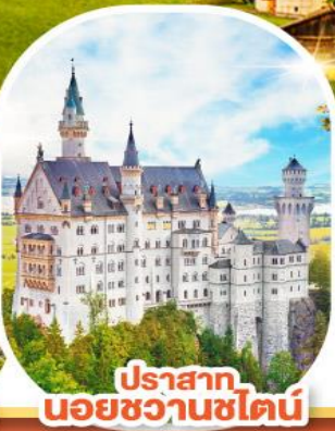
ปราสาท นอยชวานชไตน์