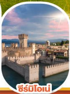
ซีร์มิโอเน่

เดินทาง 30 พ.ค. - 05 มิ.ย. 68 11-17 มิ.ย. 68