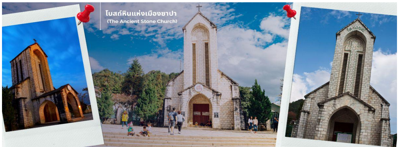
โบสถ์หินแห่งเมืองซาปา (The Ancient Stone Church)

จากนั้นพาทุกท่านชม โบสถ์หินแห่งเมืองซาปา (The Ancient Stone Church) อีกหนึ่งแลนด์มาร์กสำคัญของซาปาที่ต้องไปเช็คอิน เป็นโบสถ์หินที่สร้างขึ้นโดยชาวฝรั่งเศส เนื่องจากครั้งที่เป็นเมืองอาณานิคม มีชาวฝรั่งเศสมาอาศัยอยู่เมืองซาปาจำนวนมาก จึงเป็นโบสถ์สำคัญของเมืองนี้ที่ใช้ในการร่วมพิธีมิสซา ถึงแม้ว่าในตอนนี้อาณานิคมจะย้ายกลับไปแล้ว แต่โบสถ์แห่งนี้ก็ได้รับการอนุรักษ์เอาไว้เป็นอย่างดีและชาวซาปาที่เป็นคาทอลิกก็ยังคงใช้งานอยู่จนปัจจุบัน นำท่านช้อปปิ้งที่ ตลาดไนต์เมืองซาปา มีสินค้าให้ท่านเลือกช้อปปิ้งมากมาย ไม่ว่าจะเป็นสินค้าพื้นเมือง ของฝาก ขนม กระเป๋า รองเท้า ท่านสามารถช้อปปิ้งได้อย่างจุใจ