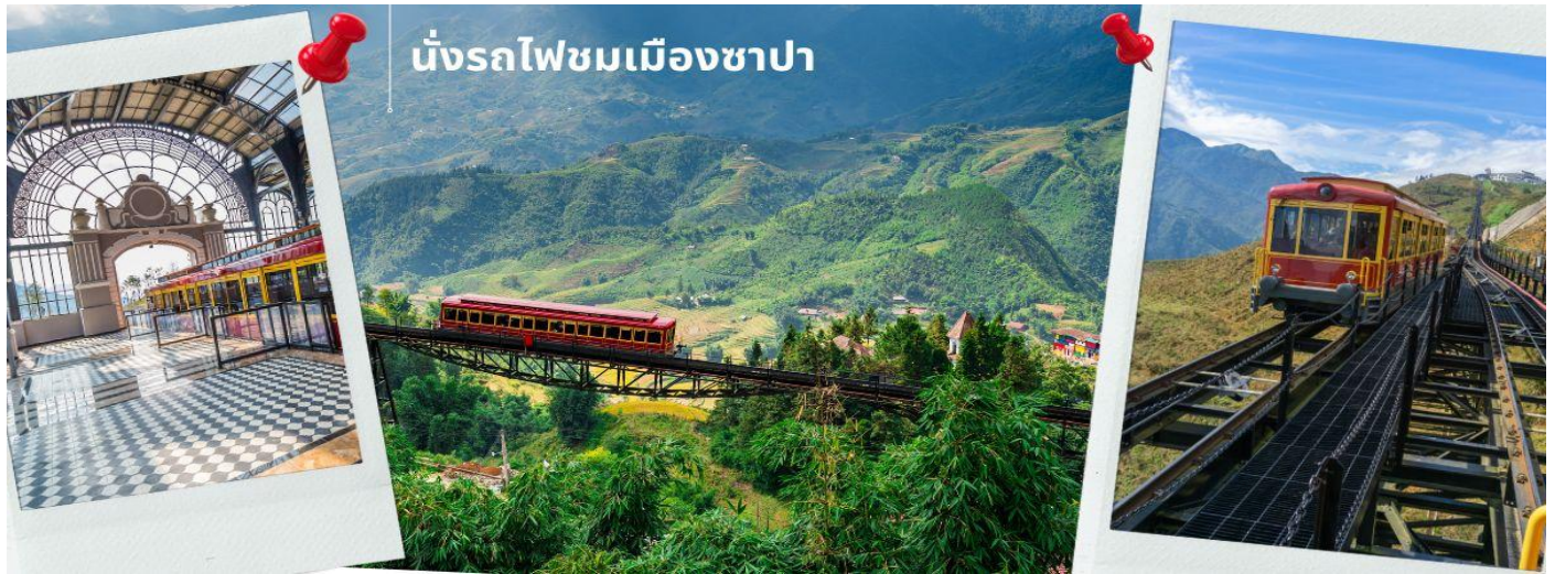
นั่งรถไฟชมเมืองซาปา

หมายเหตุ : กรณีกระเช้าฟานซีปันปิดปรับปรุงในช่วงที่ลูกค้าเดินทาง ทางผู้จัดจะเปลี่ยนรายการท่องเที่ยวไปสะพานกระงะงม้งกรมแทน