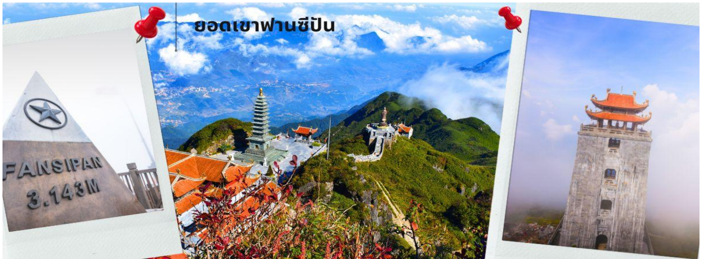
ยอดเขาฟานซีปัน