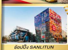
ช้อปปิ้ง SANLITUN