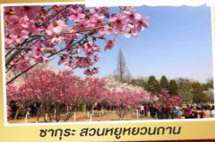
ซากุระ: สวนหยูหยวนถาน

จ่ายราคาเดียว..เที่ยวเต็มอิ่ม ..ไม่ลงร้านช้อปปิ้ง