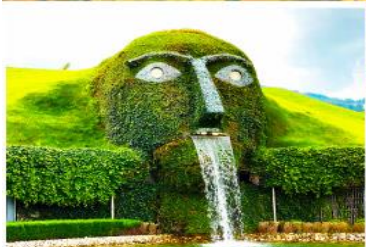
พิพิธภัณฑสถานออสเตรีย