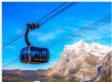
กระเช้าขึ้นยอดเขาจุงเฟรา