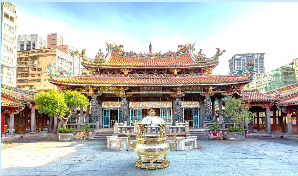
VTPE54JX-1 ไต้หวัน อาลีซาน จิวเฟิ่น ไทเป ทะเลสาบ 5 วัน 4 คืน

เช้า บริการอาหารเช้า ณ ห้องอาหารของโรงแรม นำท่านขอพรความรัก กับ ผู้เฒ่าจันทรา วัดหลงซาน (Longshan Temple) เป็นหนึ่งในวัดที่เก่าแก่และมีชื่อเสียงมากที่สุดแห่งหนึ่งของเมืองไทเป ตั้งอยู่ในแถบย่านเมืองเก่า มีอายุเกือบ 300 ไร่ ยี่ปี สถานที่สักการะสิ่งศักดิ์สิทธิ์ตามความเชื่อของชาวจีน มีรูปแบบทางด้านสถาปัตยกรรมคล้ายกับวัดพุทธของจีนแต่มีลูกผสมของความเป็นไต้หวันเข้าไปด้วย ทำให้ที่นี่เป็นอีกหนึ่งแหล่งท่องเที่ยวที่ไม่ควรพลาด และภายในก็ยังมีเทพเจ้าองค์อื่นๆตามความเชื่อของชาวจีนตามความเชื่อของแต่ละคน เช่น เจ้าแม่ทับทิม ที่เกี่ยวข้องกับการเดินทาง, เทพเจ้ากวนอู เรื่องความซื่อสัตย์และหน้าที่การงาน และเทพเย่วเหล่า หรือ ผู้เฒ่าจันทรา ที่เชื่อกันว่าเป็นเทพผู้ผูกด้ายแดงให้สมหวังด้านความรัก