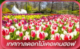
เทศกาลดอกไม้เคอเคนฮอฟ