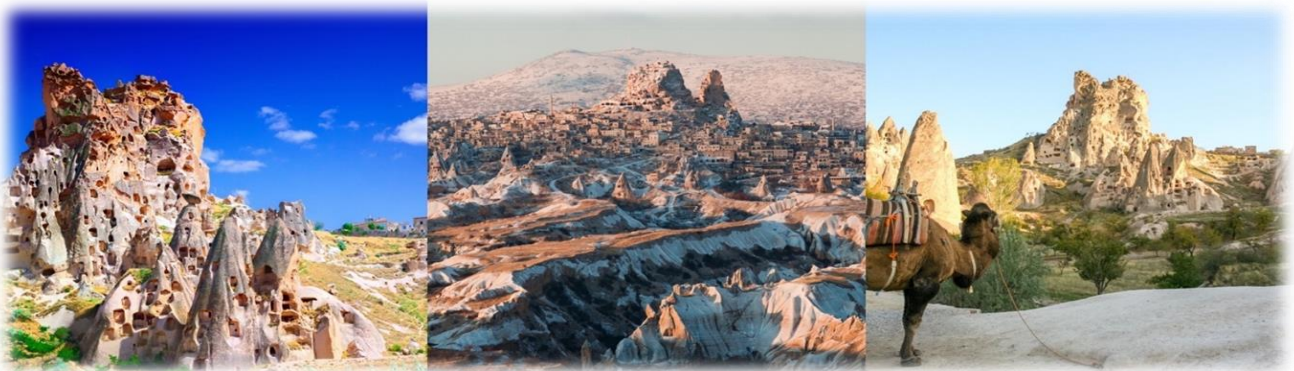
หน้า 11 (ภาพใช้เพื่อการโฆษณาเท่านั้น)

จากนั้นนำท่านถ่ายรูปด้านนอก หุบเขานกพิราบ (PIGEON VALLEY) เป็นหน้าผาที่ชาวเมืองโบราณได้ขุดเจาะเป็นรู เพื่อให้นกพิราบเข้าไปทำรังอาศัยอยู่ เนื่องจากสมัยก่อนชาวเมืองใช้นกพิราบมีหน้าที่เป็นผู้ส่ง