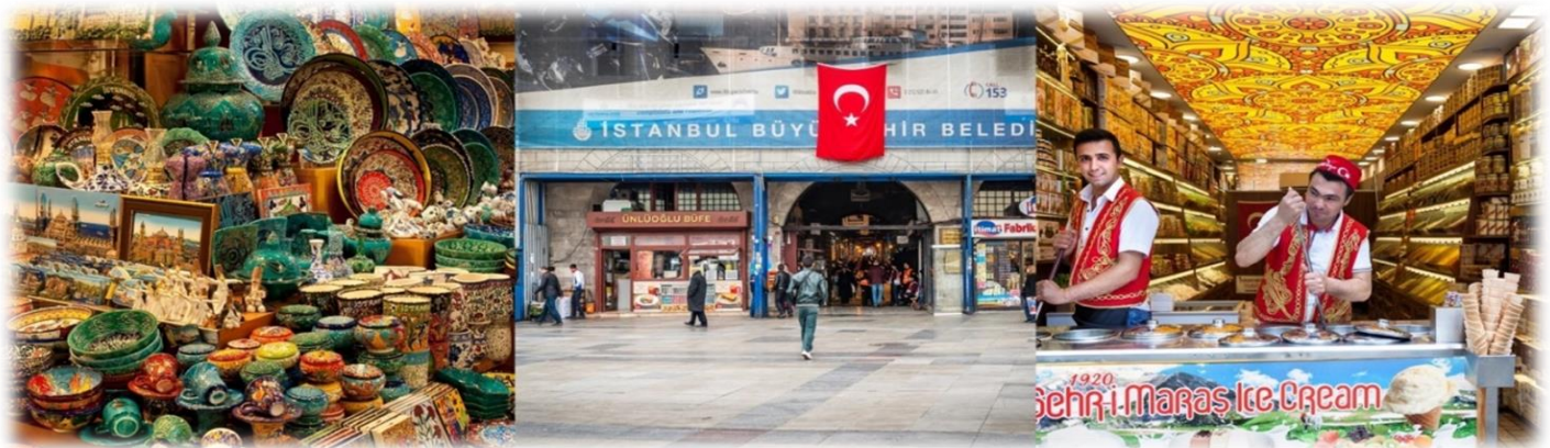
หน้า 15 (ภาพใช้เพื่อการโฆษณาเท่านั้น)

นำท่านเดินทางสู่ สไปซ์บাজার (SPICE BAZAAR) เป็นตลาดเครื่องเทศตั้งอยู่ใกล้กับสะพานกาลาตา ที่นี่ถือเป็นตลาดใหม่และเป็นตลาดที่ใหญ่เป็นอันดับสองในเมืองอิสตันบูล สร้างขึ้นตั้งแต่ช่วงปี ค.ศ. 1660 โดยเป็นส่วนหนึ่งของมัสยิดใหม่ ภายในตลาดยังมีสินค้ามากมายให้ได้เลือกซื้อ อาทิ อาหาร, เครื่องเทศ, ขนมหวานของตุรกี, เครื่องเพชรพลอย, ของที่ระลึก, ผลไม้แห้ง และเครื่องประดับต่างๆ อีกด้วย