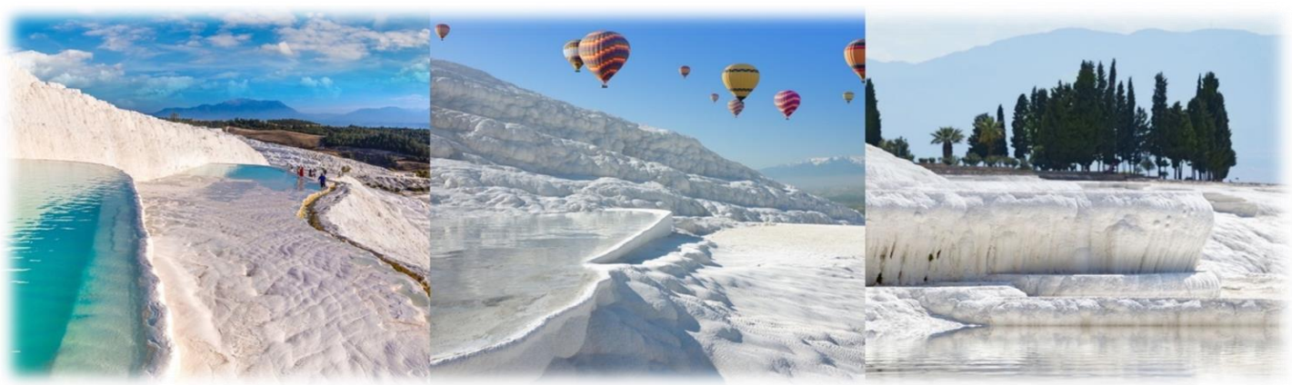
หน้า 6 (ภาพใช้เพื่อการโฆษณาเท่านั้น)

นำท่านชมปามุกคคาเล่ (Pamukkale) เป็นภาษาตุรกี แปลว่า ปราสาทปุยฝ้าย (Cotton Castle) ปามุกแปลว่าฝ้าย คาเลย์แปลว่าปราสาท เป็นน้ำตกลีขาวโพลน ลดหล่นกันลงมาเป็นชั้นส่งประกายสะท้อนกับแสงแดดระยิบระยับ บนหน้าผา โตรกเขา สีขาวบริสุทธิ์ของแร่แคลเซียมที่เกาะตัวอยู่บนเนินเขา ลดหล่นลงมาดังบ่อมปรากรเกิดจากน้ำพุร้อนที่มีแร่แคลเซียมคาร์บอเนตผสมอยู่เป็นจำนวนมากในธรรมชาติ เมื่อน้ำแร่