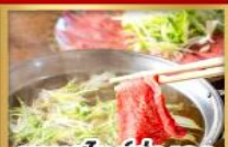
ชาบูสโตล์ฮ่องกง