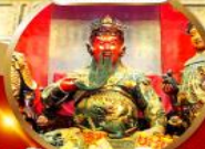
นมัสการเทพเจ้ากวนอู จออำนาจและบารมี