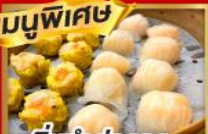
ต้มซ่าฮ่องกง