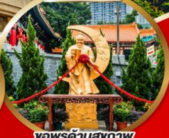
ขอพรด้านสุขภาพ