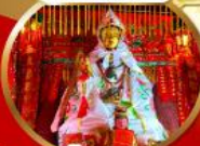
โชคลาภ และความมั่งคั่ง