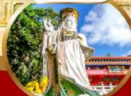
สุขภาพแข็งแรง และอายุยืน