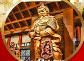
ขอพรโชคลาภ การเงิน และธุรกิจ