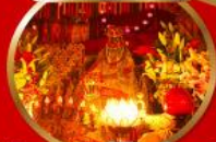
นมัสการองค์เจ้าแม่กวนอิม ที่มีอายุกว่า 600 ปี