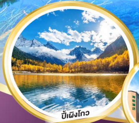
ปีเหมิงโกว