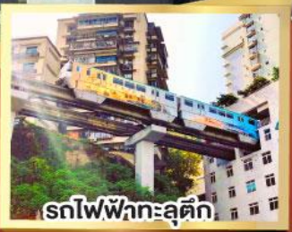
รถไฟฟ้ากะลุดัก