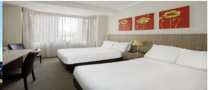
(โรงแรมย่านกลางเมือง ใกล้แหล่งช้อปปิ้ง เดินทางสะดวก) *รูปภาพเพื่อการโฆษณา*