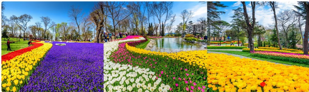
*ภาพเพื่อการโฆษณาเท่านั้น

สวนดอกทิวลิปหลากสีหลายสายพันธุ์นับล้านดอกที่สวยงามที่สุด และมีชื่อเสียงที่สุดของตุรกี ตลอดเดือนเมษายน เทศกาลทิวลิปอิสตันบูล เป็นเทศกาลประจำปี โดยจะจัดในช่วง 3 สัปดาห์สุดท้ายของเดือนเมษายน เพื่อเฉลิมฉลอง ทั้งฤดูใบไม้ผลิ และความสำคัญของดอกทิวลิป ที่มีต่ออาณาจักรออตโตมัน และวัฒนธรรมตุรกี ปกติแล้วเทศกาลนี้ จัดขึ้นที่สวนสาธารณะ ที่มีชื่อเสียงที่สุดของเมือง ให้ทุกท่านได้ถ่ายรูปตามอัธยาศัย