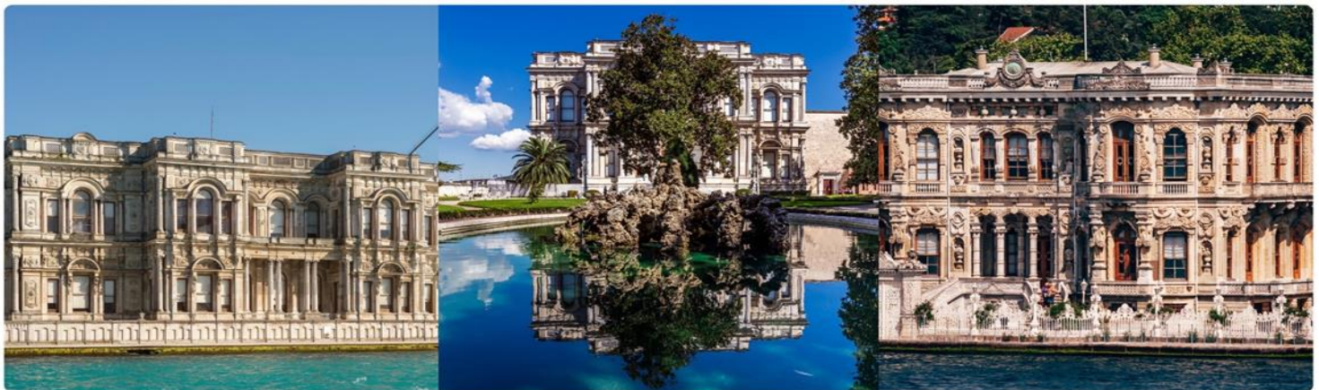
หน้าที่ 13 (ภาพเพื่อประกอบการโฆษณา)

จากนั้นนำท่านชม พระราชวังเบลเลเบย์ (BEYLERBEYI PALACE) เป็นพระราชวังที่ตั้งอยู่ริมฝั่งทะเลของช่องแคบบอสฟอรัสในฝั่งเอเชีย ใกล้กับสะพานข้ามช่องแคบฯ แห่งแรก ถือเป็นพระราชวังฤดูร้อนของจักรวรรดิออตโตมัน ถูกสร้างขึ้นเมื่อปี ค.ศ. 1861 ถึง ค.ศ. 1865 และยังเป็นสถานที่ที่ถูกใช้เป็นที่กักตัวของ สุลต่านอับดุลฮามิดที่ 2 ช่วงเวลาสุดท้ายก่อนที่พระองค์จะเสด็จสวรรคตในปี ค.ศ. 1918