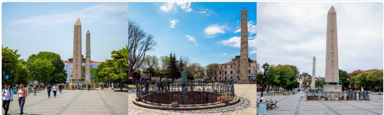
หน้าที่ 4 (ภาพเพื่อประกอบการโฆษณา)

นำท่านสู่จัตุรัสสูลต่านอะห์เมตหรือฮิปโปโดรม (HIPPODROME) สนามแข่งม้าของชาวโรมัน จุดศูนย์กลางแห่งการท่องเที่ยวเมืองเก่า สร้างขึ้นในสมัยจักรพรรดิ เซปติมิอุสเซเวรุสเพื่อใช้เป็นเวทีแสดงกิจกรรม