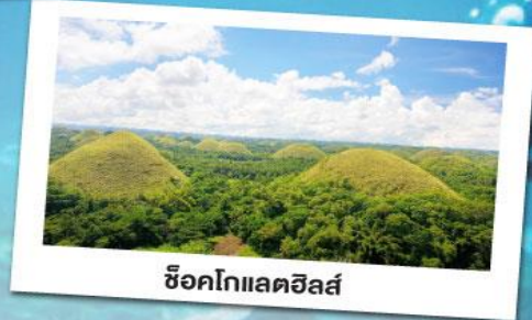
ช็อคโกแลตฮิลล์