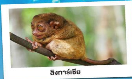
ลึงทาร์เซีย