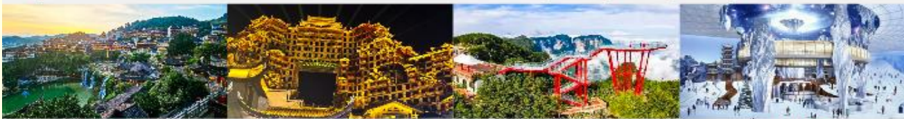
เมืองโบราณฝูหลงเจิน