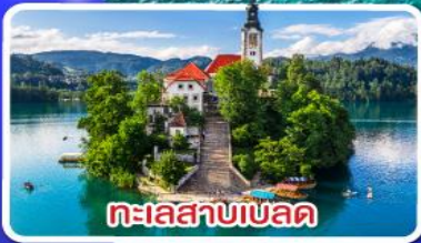
ทะเลสาบเบล็ด

ไข่มุกแห่งอาเดรียติก พร้อมขึ้นกระเช้า SRD