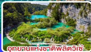
อุทยานแห่งชาติพลิตวิเช่