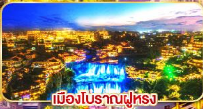
เมืองโบราณฟูหลง