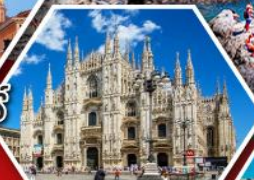
มหาวิหาร ดูโอโมแห่งมิลาน