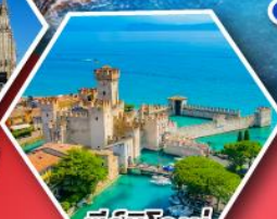
ซีร์มิโอเน่

• อุทยานโดโลไมท์ • นั่งกระเช้าสู่ยอดเขาแอลปี ดิซุสซาซี • ดินแดนห้าหมู่บ้านชิงควอเตอร์ส