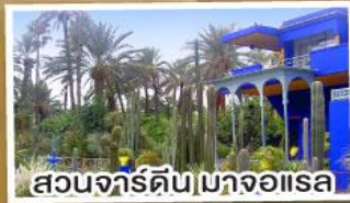
สวนจาร์ดิน มาจอแอส