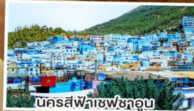
นครสีฟ้าเซฟซาอูน