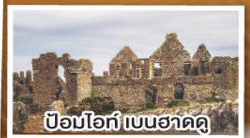
ป้อมโอ๊ก เบนฮาดดู