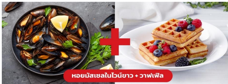
หอยมัสเซลในไวน์ขาว + วาฟเฟิล

เย็น ๑๐ รับประทานอาหารเย็น (มื้อที่10) เมนูพิเศษ!! หอยมัสเซล + วาฟเฟิล (Mussel in White wine + Waffle)