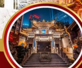
วัดหลิวอัน