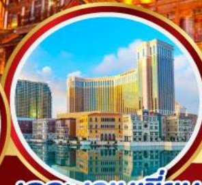
เดอะเวเนเชียน