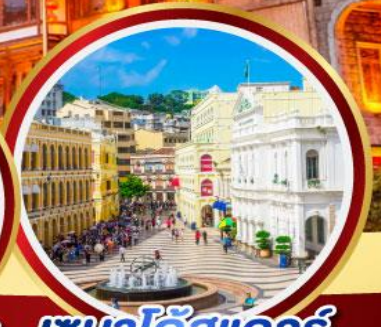
เซนาดีสแควร์