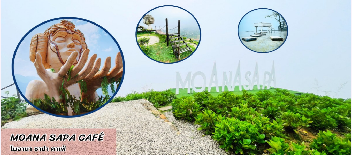
MOANA SAPA CAFÉ โมอานา ซาปา คาเฟ่

จากนั้น นำท่านช้อปปิ้ง ถนนคนเดินซาปา ให้ท่านได้เลือกซื้อของที่ระลึกและของฝากต่างๆ ตามอัธยาศัย