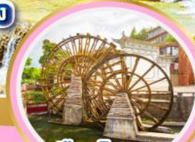
เมืองโบราณ ลี่เจียง