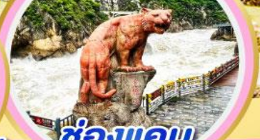
ช่องแคบ เสือกระโจน