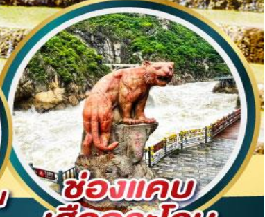
ช่องแคบ เสือกระโจน