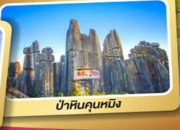
ป่าหินคุณหมิง