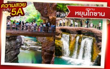
ความสวย ระดับ 5A