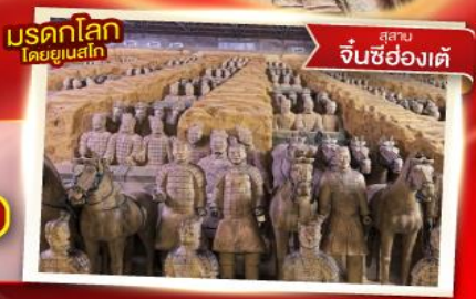
มรดกโลก โดยยูเนสโก