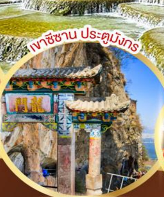
เขาซีซาน ประตุมังกร