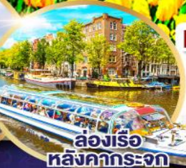
ล่องเรือหลังคึกกระจุก