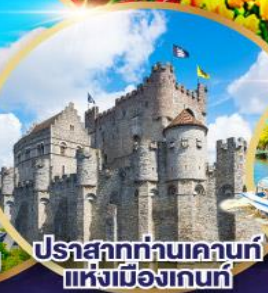
ปราสาทท่านเคานท์แห่งเมืองเกนต์