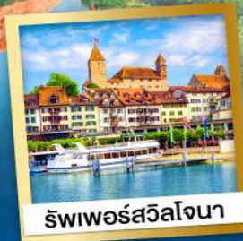
ริพเพอร์สวิลล์