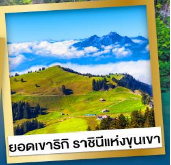
ยอดเขาริกิ ราชนิแห่งขุนเขา