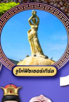
จูไห่ฟิงเซอร์เกีย