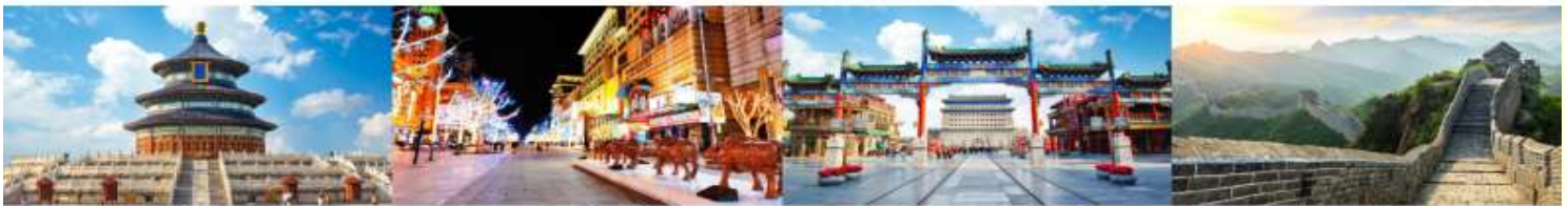
หอบูชาฟ้าเทียนถาน