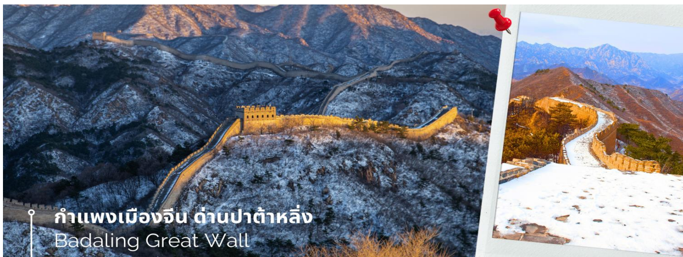
กำแพงเมืองจีน ด้านป่าต้าหลิ่ง Badaling Great Wall

จากนั้นนำท่านเดินทางชมความยิ่งใหญ่ของ กำแพงเมืองจีน ด้านป่าต้าหลิ่ง เป็นที่ตั้งของกำแพงเมืองจีนที่มีผู้เข้าชมมากที่สุด ห่างจากใจกลางเมืองปักกิ่งไปทางตะวันตกเฉียงเหนือประมาณ 80 กิโลเมตร ในเมืองป่าต้าหลิ่ง เขตหยานชิง เทศบาลนครปักกิ่ง ได้รับการอนุรักษ์อย่างดีที่สุดของกำแพงเมืองจีน นำท่านนั่งกระเช้าลอยฟ้า (รวมค่ากระเช้า) เพื่อขึ้นไปยังจุดชมวิวของด้านป่าต้าหลิ่ง ด้วยความสะดวกสบาย ให้ท่านได้มีเวลาถ่ายรูปเก็บบรรยากาศ ความสวยงามและความยิ่งใหญ่ของกำแพงเมืองจีน ในช่วงฤดูหนาว