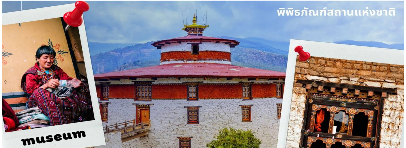
พิพิธภัณฑ์สถานแห่งชาติ

รับประทานอาหารเที่ยง ณ ภัตตาคาร (มื้อที่ 1)