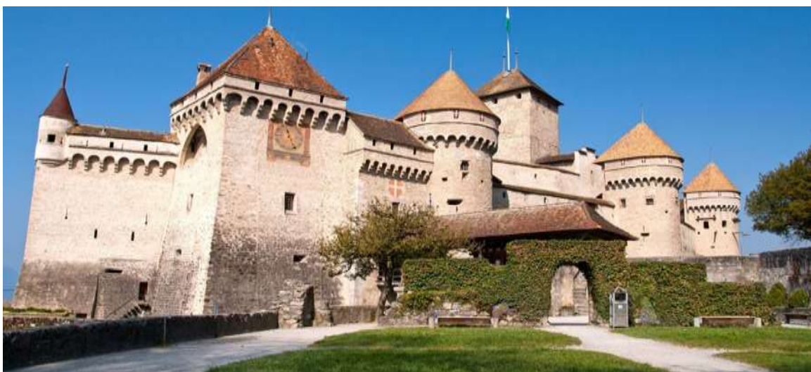
8 | รูปภาพประกอบใช้เพื่อการโฆษณาเท่านั้น

นำท่านเดินทางสู่ เมืองมงเทรอซ์ (MONTREUX) (ระยะทาง 70 กม. ใช้เวลาเดินทาง 1 ชม.) เมืองตากอากาศที่มีชื่อเสียง ได้รับสมญานามว่าเป็น ไข่มุกริเวียร่าแห่งสวิตเซอร์แลนด์ และยังเป็นศูนย์กลางของการศึกษาวิชาการโรงแรมที่เลื่องชื่อจนได้รับความนิยมสูงสุดแห่งหนึ่งของยุโรป นำท่านถ่ายรูปกับรูปปั้น เฟรดดี เมอร์คิวรี Freddie Mercury นักร้องนำวงควีน นำท่านชมความงามของ ปราสาทชิลอง (CHILLON CASTLE) ให้ท่านอิสระถ่ายรูปด้านนอกปราสาทโบราณอายุกว่า 800 ปี สร้างขึ้นบนเกาะหินริมทะเลสาบเจนีวา ตั้งแต่ยุคโรมันเรื่องอำนาจโดยราชวงศ์ SAVOY โดยมีจุดมุ่งหมายเพื่อควบคุมการเดินทางของนักเดินทางและขบวนสินค้าที่จะสัญจรผ่านไปมาจากเหนือสู่ใต้หรือจากตะวันตกสู่ตะวันออกของสวิตเซอร์แลนด์ เนื่องจากเป็นเส้นทางเดียวที่ไม่ต้องเดินทางข้ามเทือกเขาสูงชัน ปราสาทแห่งนี้จึงเปรียบเสมือนด่านเก็บภาษีซึ่งเอาเปรียบชาวสวิสมานานนับร้อยปี