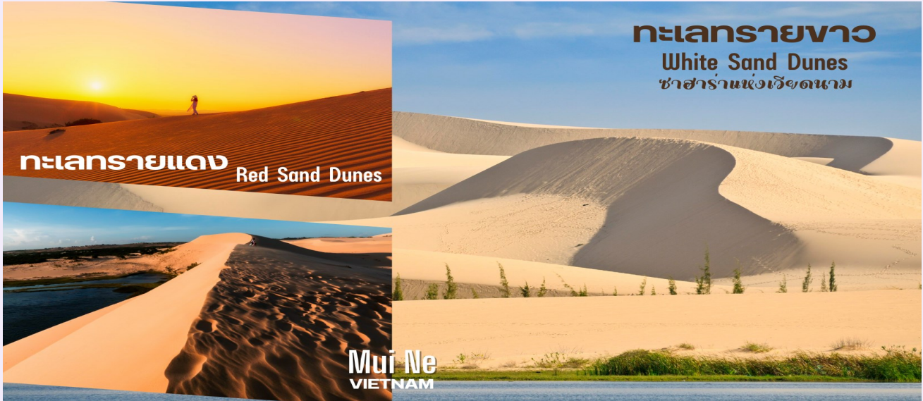
ทะเลทรายขาว White Sand Dunes ซาฮาราแห่งเวียดนาม