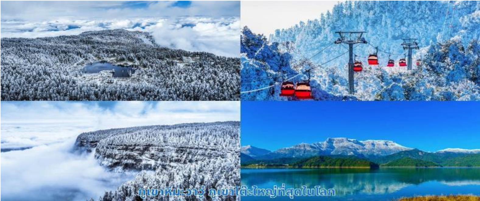
ภูเขาหิมะวาร์ู ภูเขาโต๊ะใหญ่ที่สุดในโลก

จากนั้นนำท่านเที่ยวชม ภูเขาหิมะวาร์ู ภูเขารูปโต๊ะใหญ่ที่สุดในโลก นำท่านขึ้นกระเช้าขึ้นสู่ยอดเขา ตั้งอยู่ในเขตหงหย่า เมืองเหมยซาน ซึ่งเป็นบ้านเกิดของตงโป มณฑลเสฉวน โดยมีความสูง 2,830 เมตรจากระดับน้ำทะเล และมีพื้นที่บนยอดเขาประมาณ 110,000 ตร.กม. ที่นี่ได้รับการจัดอันดับให้เป็นแหล่งท่องเที่ยวระดับ AAAA แห่งชาติในเดือนมีนาคม 2019 เป็นที่รู้จักกันในนามของ โลกแห่งน้ำ โลกแห่งถ้ำ อาณาจักรแห่งดอกไม้ เพลแห่งหิมะ บ้านเกิดของเมฆ และพิพิธภัณฑ์สัตว์และพืช