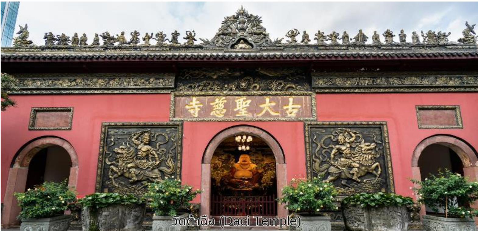
วัดต้าจื่อ (Daci Temple)

เช้า บริการอาหารเช้า ณ ห้องอาหารของโรงแรม