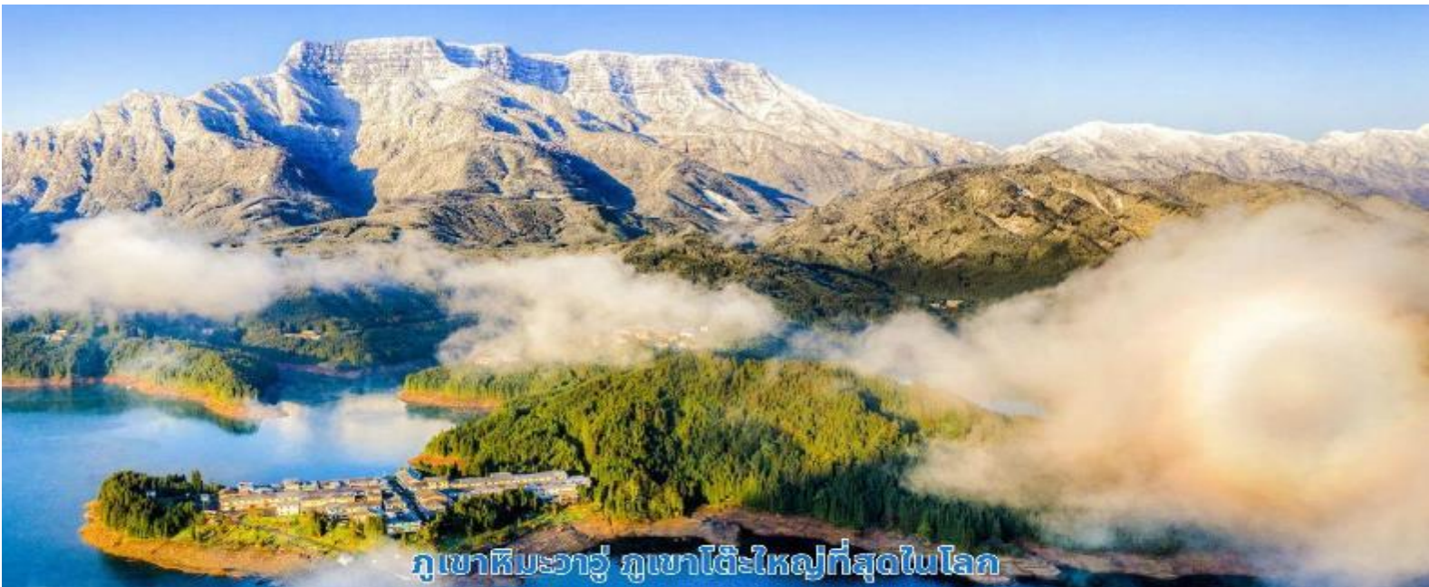
ภูเขาหิมะวาร์ู ภูเขาโต๊ะใหญ่ที่สุดในโลก

บ่าย จากนั้นนำท่านเดินทางกลับเข้าสู่เมืองเฉิงตู