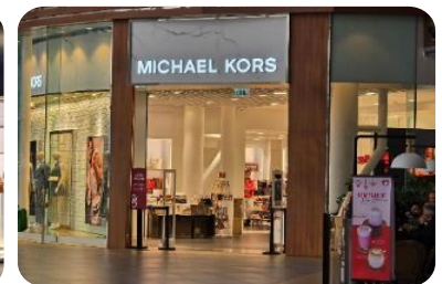
GO1MFM-NX012 มาเก๊า ฮ่องกง ดิสนีย์แลนด์ นองปิง เวนเซียน 4 วัน 2 คืน (รวมบัตรดิสนีย์) โดยสายการบิน Air Macau (NX)