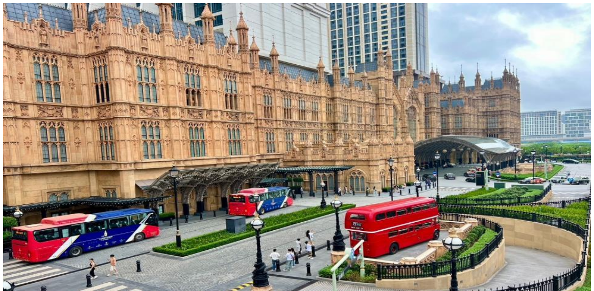
GO1MFM-NX012 มาเก๊า ช่องกง คิสนีย์แลนด์ นองปิง เวนเซียน 4 วัน 2 คืน (รวมบัตรคิสนีย์) โดยสายการบิน Air Macau (NX)

นำท่านถ่ายภาพกับ ลอนดอนเนอร์ (The Londoner Macau) เป็นสถานที่ท่องเที่ยวอดนิมที่ตั้งอยู่ในมาเก๊า เป็นถนนที่จำลองสัญลักษณ์ที่สำคัญของเมืองลอนดอน ประเทศอังกฤษ อย่างเช่น บิ๊กเบน สะพานทาวเวอร์ บริดจ์ และตู้โทรศัพท์สีแดง อิสระให้ท่านได้เพลิดเพลินกับการถ่ายรูป