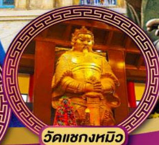
วัดเขกงหมิว