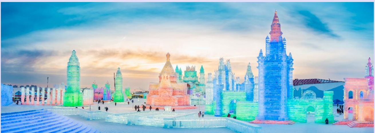
VHRB64XJ-37 ฮาร์บิน เทียวเพลิน คู่แม่เงิน ราคา 4 คืน 3 ดาว BY XU

จากนั้นนำท่านชมความยิ่งใหญ่ของงานฤดูหนาวระดับโลก เทศกาลแกะสลักหิมะและน้ำแข็งแห่งเมืองฮาร์บิน ที่ใหญ่ที่สุดในโลก Harbin International Ice and Snow Festival ซึ่งใน 1 ปีจะจัดขึ้นเพียงครั้งเดียวเท่านั้น ถ่ายรูปกับประติมากรรมน้ำแข็งสุดอลังการที่ถูกแกะสลักโดยช่างฝีมือดีจากทั่วทุกมุมโลก โดยนำก้อนน้ำแข็งหลายหมื่นก้อนมาแกะสลักเพื่อประกอบเป็นรูปร่างต่างๆ จนกลายเป็นเมืองที่เหมือนหลุดออกมาจากเทพนิยาย มีปราสาทขนาดใหญ่สวยงามตระการตา ยามค่ำคืนจะเปิดไฟสีอันสวยงาม นอกจากถ่ายรูปสวยๆ ยังมีกิจกรรมอื่นๆ ที่น่าสนใจมากมาย เช่น นั่งรถม้าเที่ยวชมรอบๆ การเล่นสไลด์เดอร์น้ำแข็ง การเล่นกระดานลื่นน้ำแข็ง ถอดเสื้อผ้าว่ายน้ำในสระน้ำท่ามกลางอากาศติดลบมากกว่า -20 องศา การเล่นไอซ์สเกต การเดินเข้าชมถ้ำน้ำแข็ง เป็นต้น (หมายเหตุ : เทศกาลแกะสลักหิมะ และน้ำแข็งแห่งเมืองฮาร์บิน ในแต่ละปีการแกะสลักรูปแบบอาจแตกต่างกันออกไป สำหรับการจัดงานในปี 2025 จะเปิดอย่างเป็นทางการในวันที่ 5 มกราคม 2568 แต่จะเริ่มเข้าชมได้ตั้งแต่ช่วงการเตรียมงาน คือ วันที่ 10 ธันวาคม 2567 ไปจนถึงประมาณปลายเดือนกุมภาพันธ์ หรือจนกว่าหิมะจะละลาย)