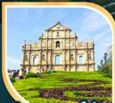
วิหารเซนต์ปอล