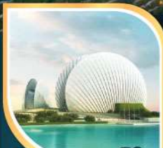
โรงละครหอยโข่ง