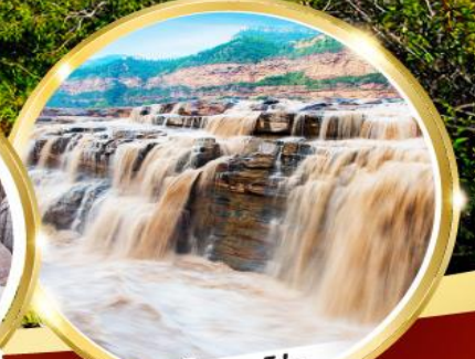
น้ำตกหูโงว