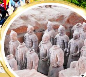
กองทัพทหารดินเผาจีนซี