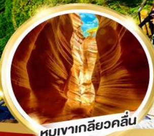
หุบเขาเกลียวคลื่น