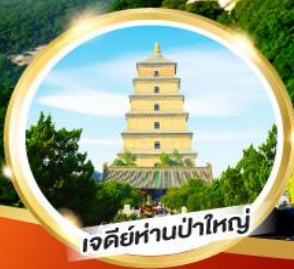
เจดีย์ห่านป่าใหญ่