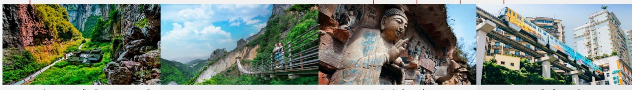
อุทยานแห่งชาติหลุมฟ้า 3 สะพานสวรรค์ หุบเขารอยแยกอุ๋หลิงซาน ผาหินแกะสลักต้าจู้ เขาเป่าตึงซาน รถไฟฟ้าทะเลสาบ

*ทางบริษัทฯ ขอสงวนสิทธิ์ในการสลับโปรแกรมทัวร์ตามความเหมาะสมขึ้นอยู่กับสถานการณ์หน้างาน โดยคำนึงถึงผลประโยชน์ของลูกค้าเป็นสำคัญ