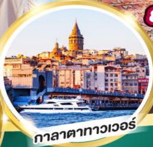
กาลาตาทาวเวอร์