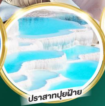
ปราสาทปูยฝ้าย