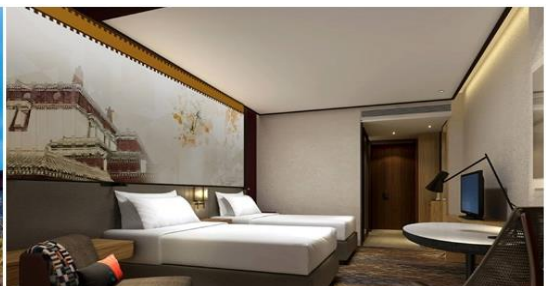
AC02 HAPPINESS KUINMING -DALI-LIJANG (SHANGRI-LA) 0509 BT TG