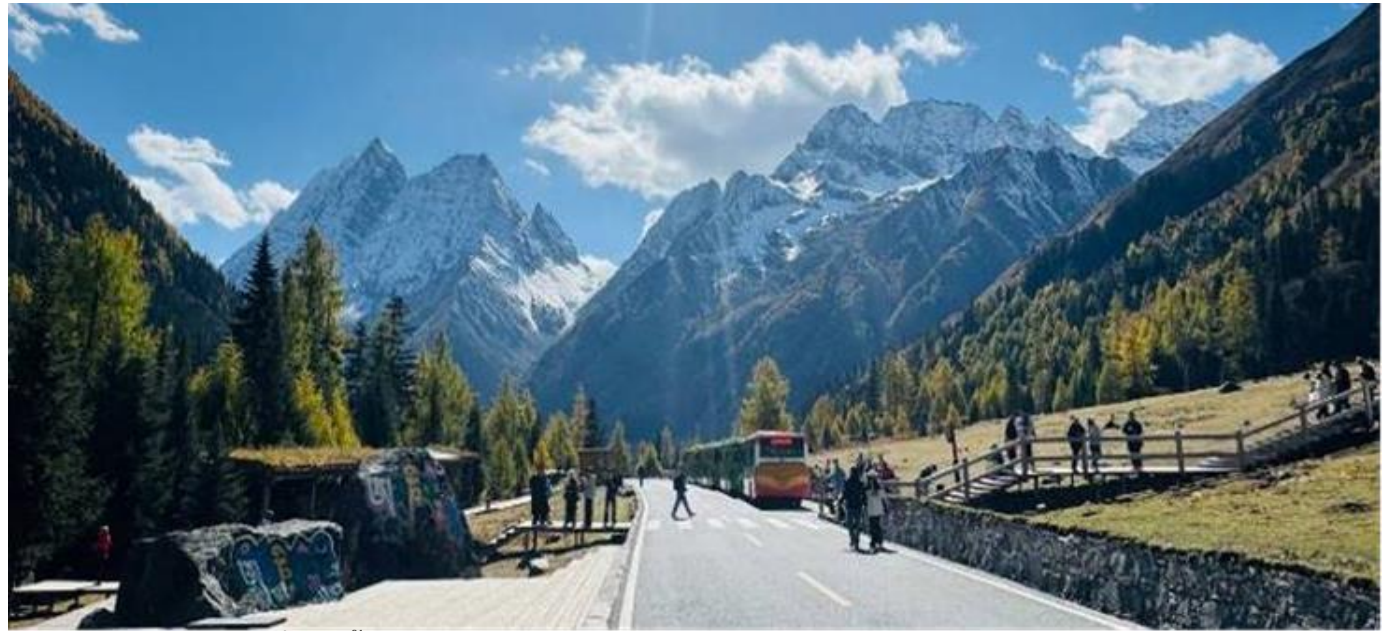
GO1TFU-TG108 เฉิงตู สี่ฤดู ปีเฉิงโกว ต่ากู่ปิงชาน จิวจ้ายโกว 7วัน 6คืน (นั่งรถไฟความเร็วสูง) * ไม่ลงร้านช้อปปิ้ง โดยสายการบิน Thai Airways (TG)

เช้า รับประทานอาหารเช้า ณ ห้องอาหารภายในโรงแรม (มื้อที่ 2)