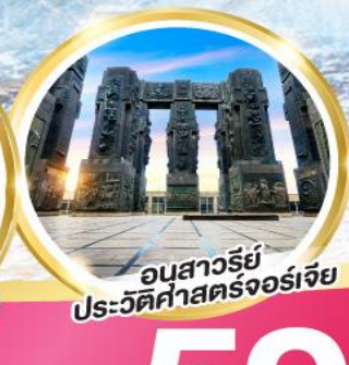
อนุสาวรีย์ประวัติศาสตร์จอร์เจีย