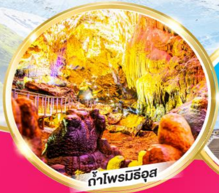
ถ้ำโพรมีธอส