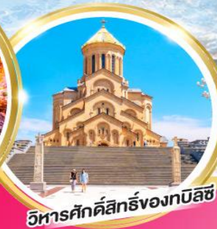
วิหารศักดิ์สิทธิ์ของทบิลีซี