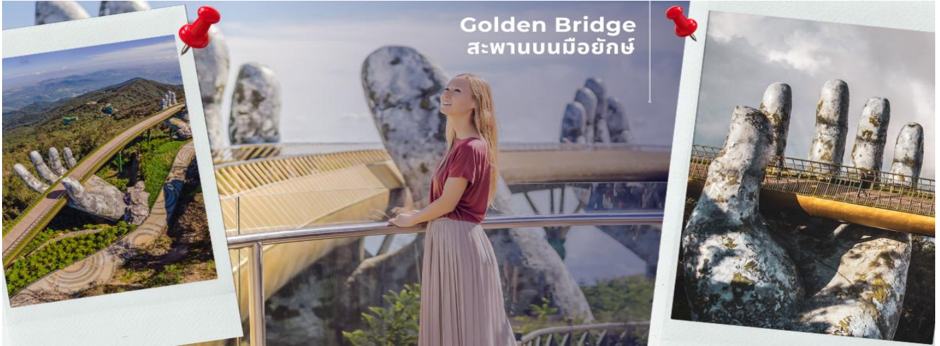
Golden Bridge สะพานบนมือยักษ์

CFDD5 ดานัง-ฮอยอัน-พักบานาฮิลล์ 3 วัน 2 คืน FD (MAY-OCT25)