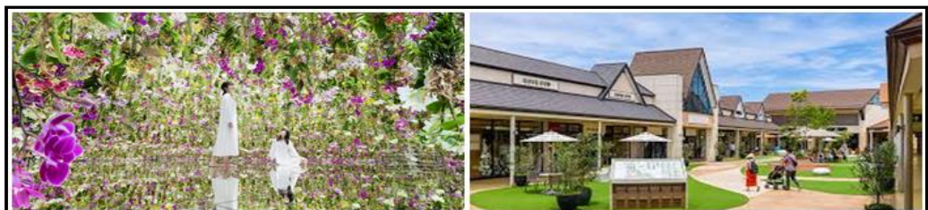
J03_3 APPLE ROMANCE FLOWER IN JAPAN (ONSEN IN ROOM) 7D 4N -- 12-18 APR 25

เที่ยง รับประทานอาหารกลางวัน อิสระตามอัธยาศัย บ่าย พาทุกท่านเยี่ยมชม TeamLab Planets Tokyo เป็นพิพิธภัณฑ์ที่คุณเดินผ่านน้ำ มีพื้นที่จัดนิทรรศการขนาดใหญ่ 4 แห่งและสวน 2 แห่ง และเดินสำรวจด้านในนิทรรศการด้วยเท้าเปล่า พร้อมสัมผัสได้ถึงความมหัศจรรย์แห่งศิลปะ ที่จัดแสดงอยู่ในพื้นที่ที่กว้างใหญ่แห่งนี้ จากนั้นนำท่านเดินทางสู่ มิตซึเออาร์ทเล็ทพาร์ค คิซาราชิ เออาร์ทเล็ทนี้มีขนาดใหญ่ที่มีสินค้า แบรนด์ดังทั้งในและต่างประเทศรวมกว่า 308 ร้าน นับเป็นศูนย์การค้าที่ใหญ่ที่สุดในประเทศญี่ปุ่น ซึ่งกว่า 100 ร้านเป็นร้านปลอดภาษี สิ่งห้ามพลาดใน MITSUI OUTLET PARK KISARAZU แห่งนี้ก็คือBLUE LABEL/BLACK LABEL CRESTBRIDGE ของ Burberry ซึ่งปรับปรุงร้านใหม่ในเดือนตุลาคม 2019 รวมทั้งร้านซึ่งเป็นตัวแทนเทรนด์แฟชั่นของญี่ปุ่นอย่าง BEAMS, COACH, Y-3, Matsumoto Kiyoshi, THE NORTH FACE, Columbia ในแบรนด์ OUTDOOR ฯลฯ