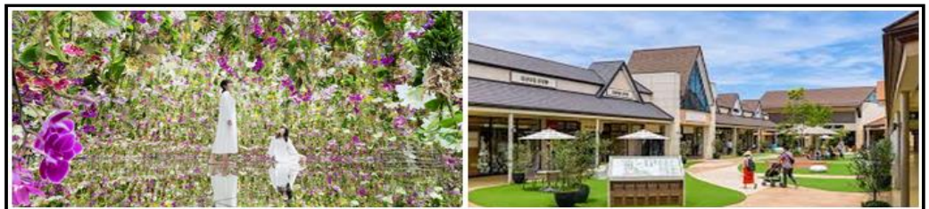
J03_3 APPLE ROMANCE FLOWER IN JAPAN (ONSEN IN ROOM) 7D 4N -- 12-18 APR 25

เที่ยง รับประทานอาหารกลางวัน อิสระตามอัธยาศัย บ่าย พาทุกท่านเยี่ยมชม TeamLab Planets Tokyo เป็นพิพิธภัณฑ์ที่คุณเดินผ่านน้ำ มีพื้นที่จัดนิทรรศการขนาดใหญ่ 4 แห่งและสวน 2 แห่ง และเดินสำรวจด้านในนิทรรศการด้วยเท้าเปล่า พร้อมสัมผัสได้ถึงความมหัศจรรย์แห่งศิลปะ ที่จัดแสดงอยู่ในพื้นที่ที่กว้างใหญ่แห่งนี้ จากนั้นนำท่านเดินทางสู่ มิตซึเออาร์ทเล็ทพาร์ค คิซาราชิ เออาร์ทเล็ทนี้มีขนาดใหญ่ที่มีสินค้าแบรนด์ดังทั้งในและต่างประเทศรวมกว่า 308 ร้าน นับเป็นศูนย์การค้าที่ใหญ่ที่สุดในประเทศญี่ปุ่น ซึ่งกว่า 100 ร้านเป็นร้านปลอดภาษี สิ่งห้ามพลาดใน MITSUI OUTLET PARK KISARAZU แห่งนี้ก็คือBLUE LABEL/BLACK LABEL CRESTBRIDGE ของ Burberry ซึ่งปรับปรุงร้านใหม่ในเดือนตุลาคม 2019 รวมทั้งร้านซึ่งเป็นตัวแทนเทรนด์แฟชั่นของญี่ปุ่นอย่าง BEAMS, COACH, Y-3, Matsumoto Kiyoshi, THE NORTH FACE, Columbia ในแบรนด์ OUTDOOR ฯลฯ