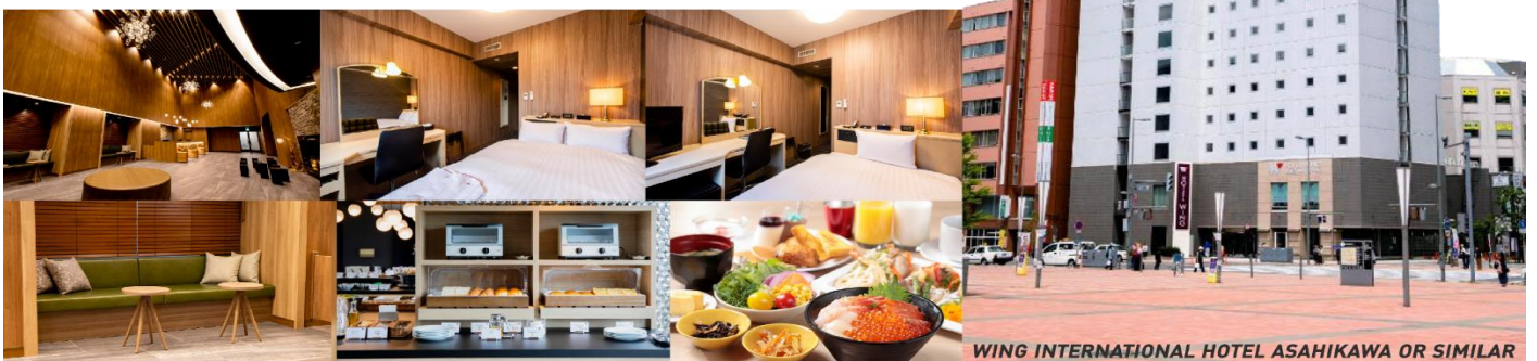
WING INTERNATIONAL HOTEL ASAHIKAWA OR SIMILAR

ที่พัก WING INTERNATIONAL HOTEL หรือ ART ASAHIKAWA, หรือเทียบเท่า