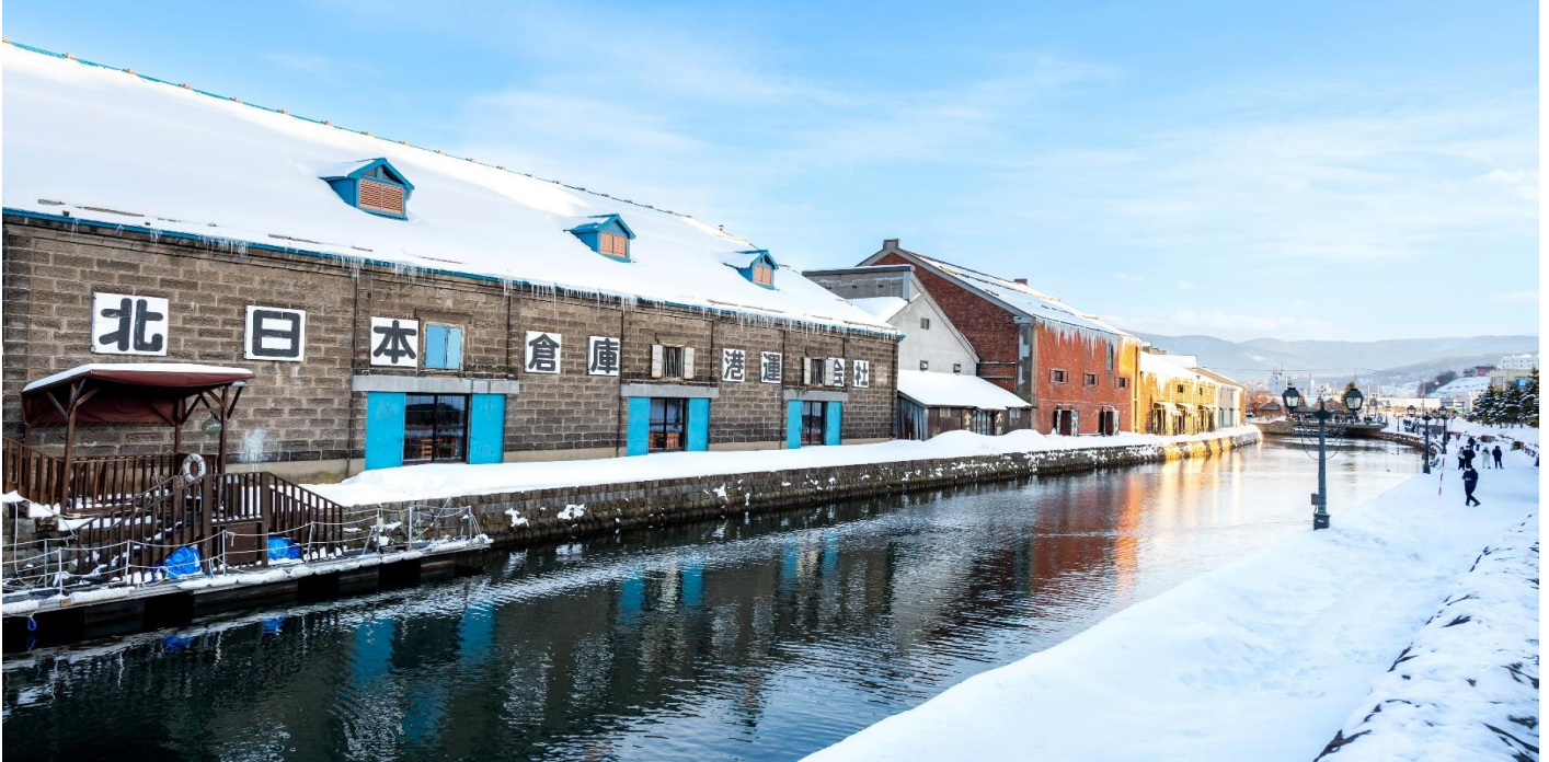
เที่ยง อีศระอาหาร เพื่อความสะดวกในการท่องเที่ยว

บรรยากาศสุดแสนโรแมนติก คลองแห่งนี้สร้างเมื่อปี 1923 โดยสร้างขึ้นจากการถมทะเล เพื่อใช้สำหรับเป็นเส้นทางขนถ่ายสินค้ามาเก็บไว้ที่โกดัง แต่ภายหลังได้เลิกใช้และมีการถมคลองครึ่งหนึ่งเพื่อทำถนนหลวงสาย 17 แล้วเหลืออีกครึ่งหนึ่งไว้เป็นสถานที่ท่องเที่ยวมีการสร้างถนนเรียบคลองด้วยอิฐแดงเป็นทางเดินเท้ากว้างประมาณ 2 เมตร