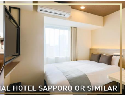
WING INTERNATIONAL HOTEL SAPPORO OR SIMILAR