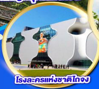
โรงละครแห่งชาติไถจง