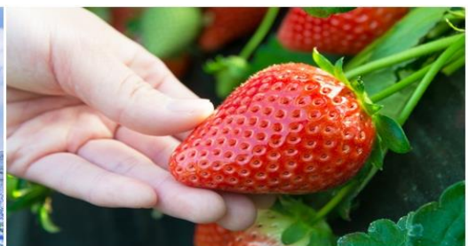
AJ12_3 HAPPINESS TRAVEL PHOTOGRAPHY