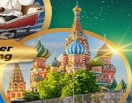
St. Basil's Cathedral