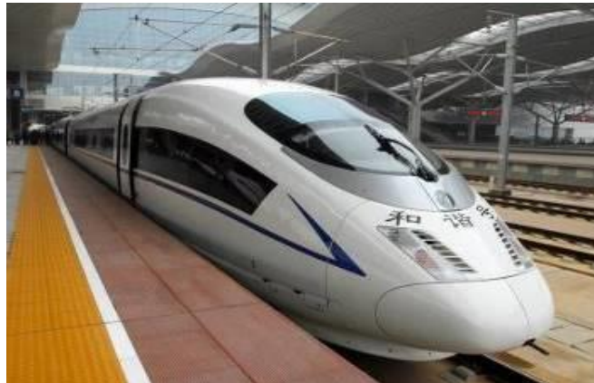
GO1TFU-SL004 เฉิงตู ภูเขาสี่ฤดูนี้ ปีเผิงโกว จิวจ้ายโกว(นั่งรถไฟความเร็วสูง) 6วัน 5คืน โดยสายการบิน Lion Air (SL)