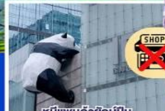
หมีแพนด้ายักษ์ปีนตึกถนนชุนชี่