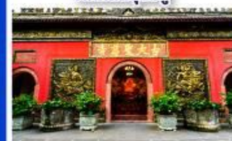
วัดต้าเจี๊ว