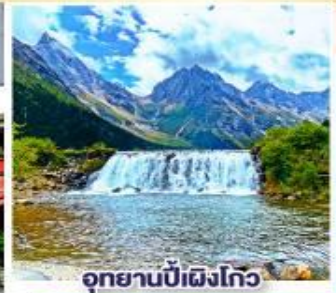
อุทยานπίเฝงโกว